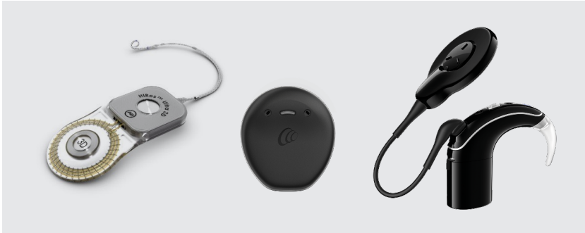
Figuur 1: links inwendig deel (implantaat), midden en rechts uitwendig deel (processor)

Het CI bestaat uit twee delen: een uitwendig en een inwendig deel. Het uitwendige deel bestaat uit een geluidsprocessor met een microfoon, een accu en een zendspoel. Het uitwendige deel wordt achter het oor en/of op het hoofd gedragen. Het inwendige deel zit onder de huid. Het wordt tijdens een operatie geplaatst. Het inwendige deel is het eigenlijke implantaat. Het bestaat uit een ontvangtspoel en een elektrodenbundel. De ontvangtspoel wordt onder de hoofdhuid, op het bot van de schedel, geplaatst. De elektrodenbundel wordt in het slakkenhuis geplaatst.