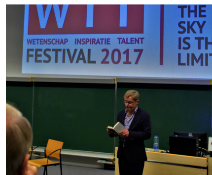
Foto: Herman Finkers opende het WIT Festival in 2017

hoe zij omgaan met thema's die vaak ook onderwerp zijn van het maatschappelijk debat. Jaarlijks organiseert de AMC Foundation samen met een aantal jonge onderzoekers dit festival.